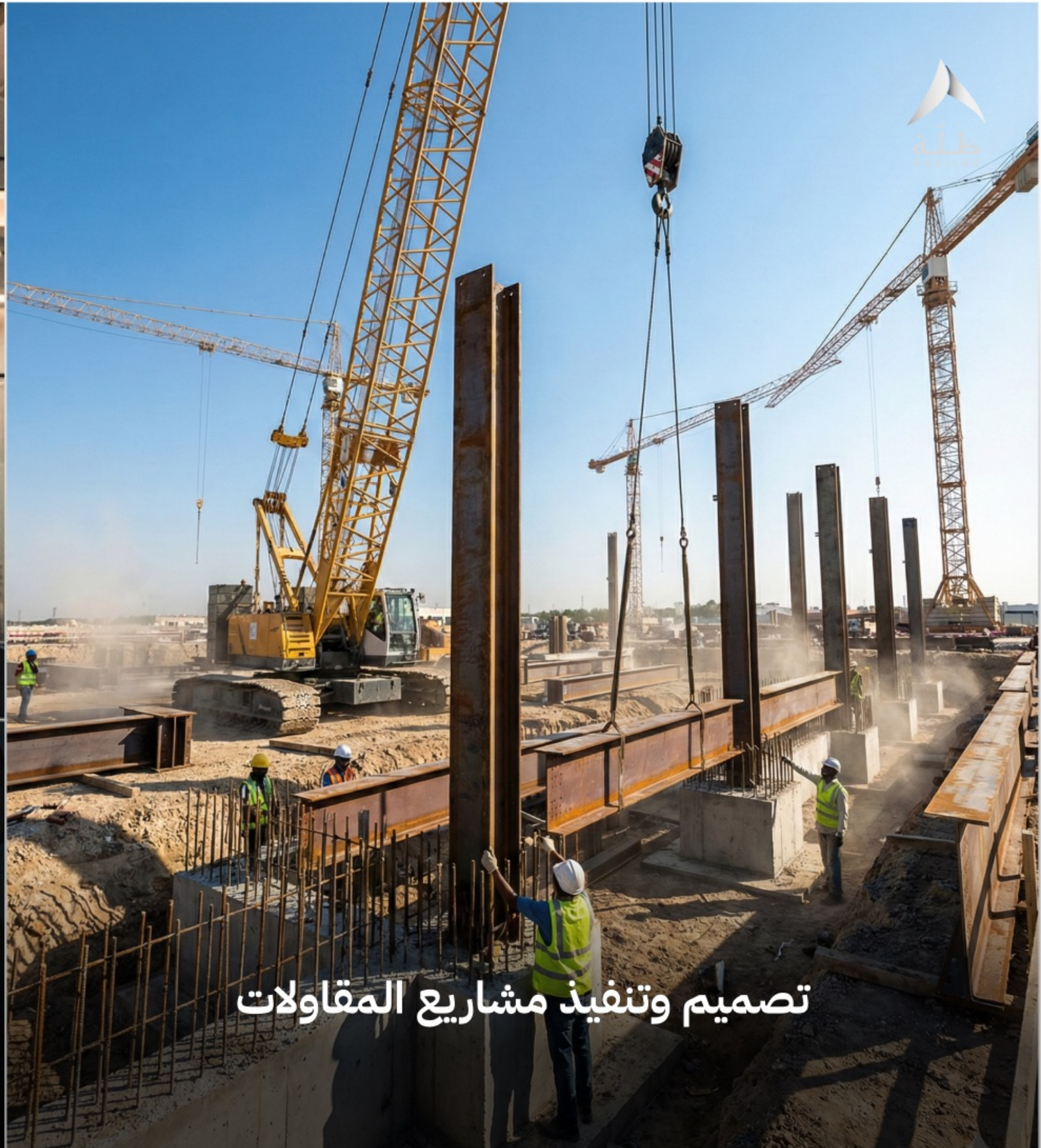
تصميم وتنفيذ مشاريع المقاولات