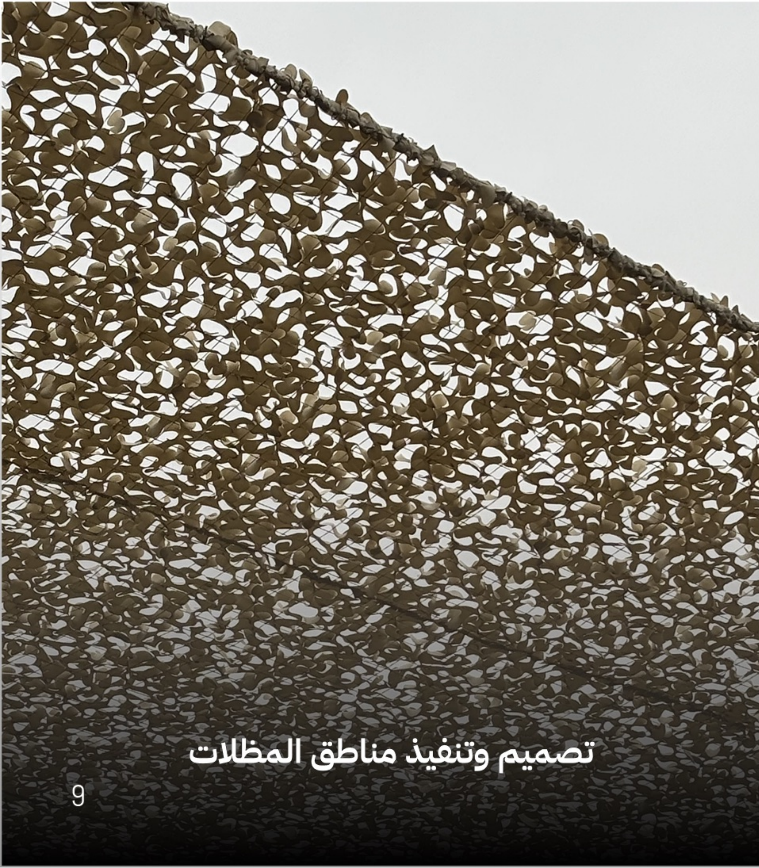
تصميم وتنفيذ مناطق المظلات