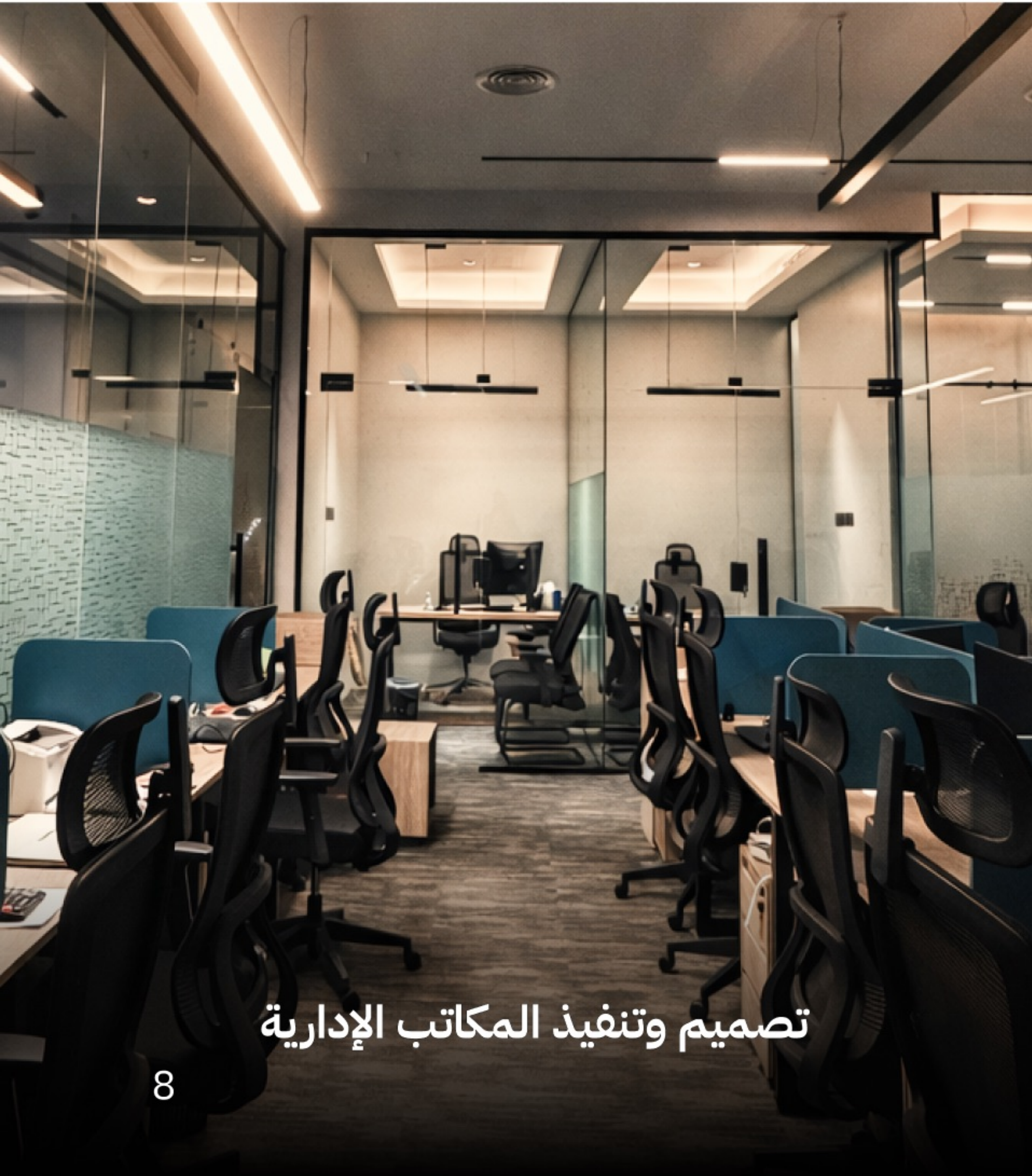
تصميم وتنفيذ المكاتب الإدارية