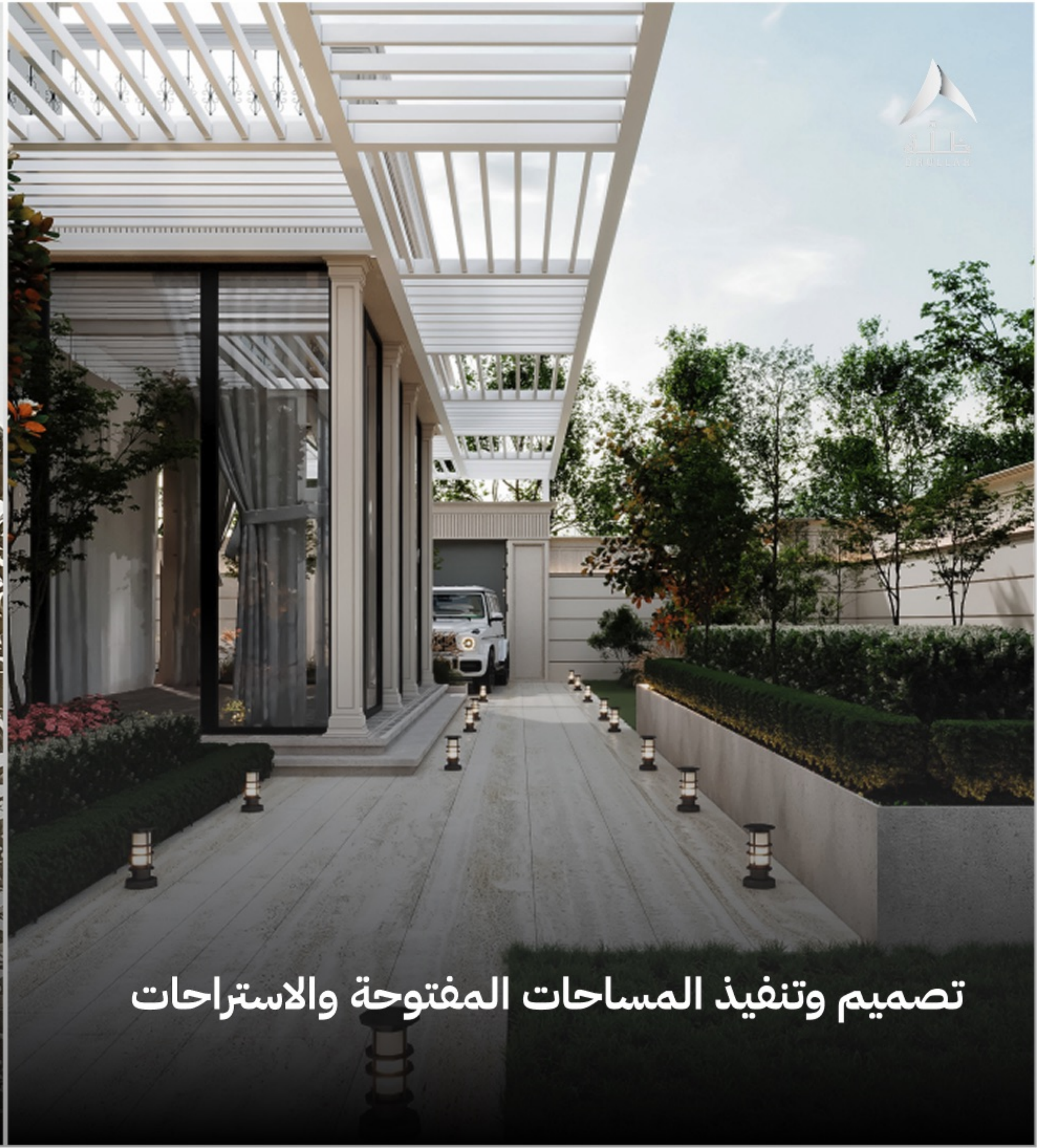
تصميم وتنفيذ المساحات المفتوحة والاستراحات